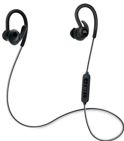
JBL Reflect Contour

هدفونهای بیسیم به سه گروه تقسیم میشوند: مادون فرمز (IR)، فرکانس-رادیویی (RF) و بلوتوث. عرضه هدفونهای بیسیم و به ویژه بلوتوثی به همراه گسترش فایل‌های صوتی mp3 و نیز گسترش روز افزون گوشیهای همراه باعث محبوبیت فراوان این نوع هدفونها شده اند.