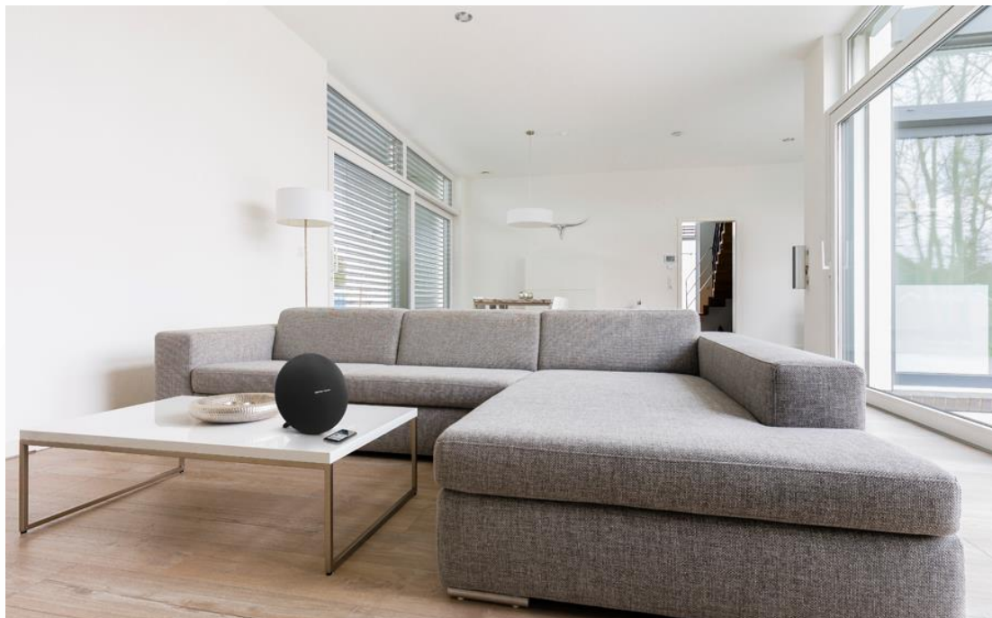
Harman Kardon Onyx Studio 4

به لطف قابلیت بلوتوث میتوانید به صورت بیسیم، از موبایل و تبلت ، کامپیوتر و ... به بلندگوی بلوتوث وصل شوید و ساعتها به پخش موسیقی و صوت مورد علاقه خود در محیط داخل ویا خارج از منزل پردازید ، از شر کابل و سیم و پریز برق خلاص شوید و به راحتی آنها را حمل کنید، علاوه بر اینکه صدایی با کیفیت و پر حجم داشته باشید.