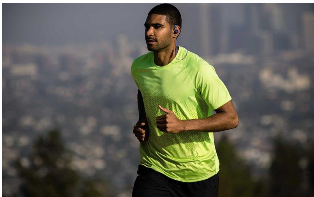
JBL Reflect Contour

قابلیت بیسیم بودن، سبکی و قابلیت حمل آسان باعث میشود که بتوانید به راحتی این هدفونها را به هر جایی مثل جاهای شلوغ، خیابان و به خصوص به محیط های ورزشی و مسافرت جایی که سیمهای آویزان میتوانند در دسر درست کنند ببرید.