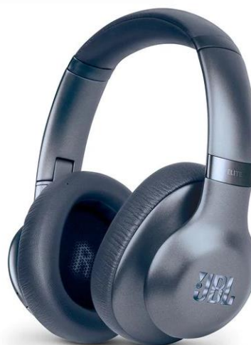
JBL Everest Elite 750NC